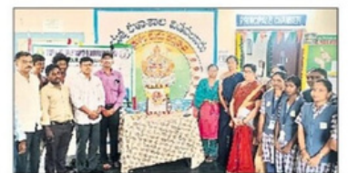
విడవలూరు: సావిత్రిబాయికి నివాళులర్పిస్తున్న అధ్యాపకులు