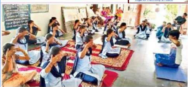
విడవలూరు ప్రభుత్వ డిగ్రీ కళాశాలలో యోగా చేస్తున్న విద్యార్థులు