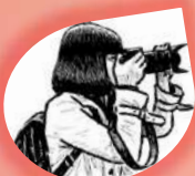
B.Swapna IBSC (BZC)