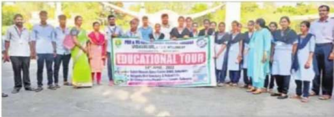
షార్ కేంద్రంలో విద్యార్థులు